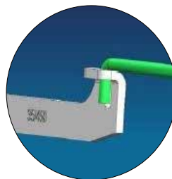
Varillas de transmisión redondas